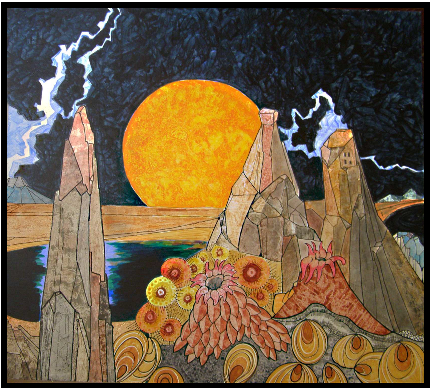
Francisco Lezcano – Paisaje – 2008 – Serie: Viaje por ultramundos.- 100x90 – Técnica mixta- Lienzo